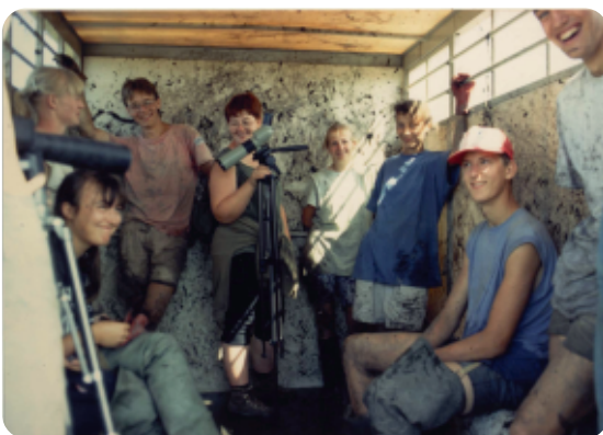
Marais du Vigueirat, 1992