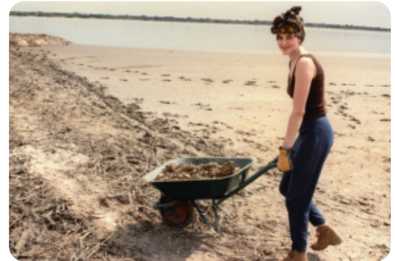
Sénégal, réserve de Guemboul Saint Louis, 1996 Coralie Massez