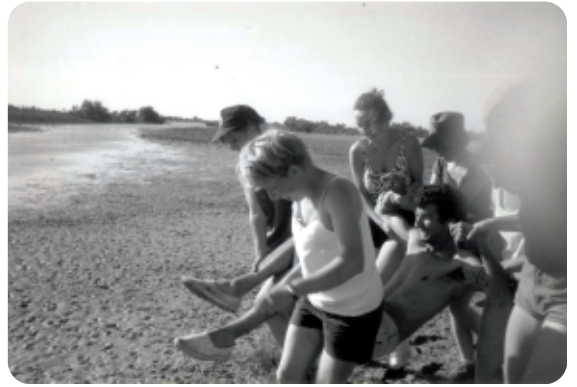
Marais du Vigueirat, 1996

Flora : On a pris le relais maintenant !